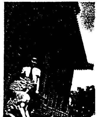
(一九四八年 摄于南京 鸡鸣寺附 近)